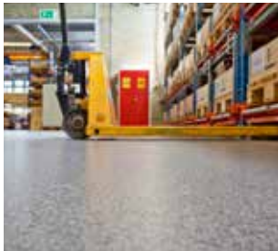
Revêtements de sols industriels Sikafloor® pour les entrepôts, centres de distribution et plateformes logistiques.

Sika® ViscoCrete®, SikaRapid®, Sika® Control, Sika® Fiber, Sika® Air et plus encore : Une gamme d'adjuvants et d'additifs haute performance destinée au béton coulé au chantier, la préfabrication ou les applications de voirie lourde en béton.