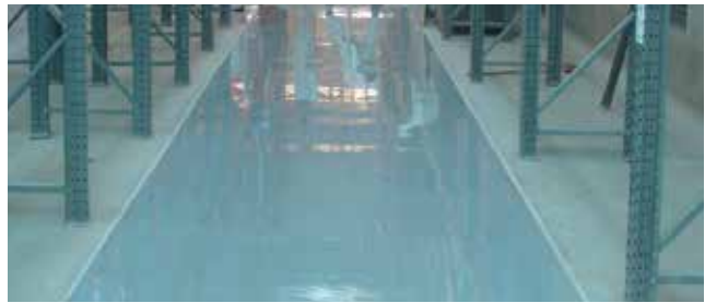
SikaGrout®, Sika AnchorFix®, SikaTop®, etc. : Solutions pour travaux d'ancrages lourds et structuraux (ancrages chimiques, coulis cimentaires ou polymères, etc.) et mortiers spéciaux pour travaux sur béton.