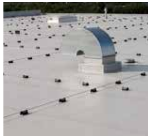
Nouvelles toitures et réfection avec les membranes Sika® Sarnafil® et Sikalastic® RoofPro.