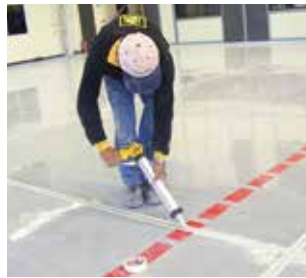
Sikaflex®, Sikasil® et Sikadur® : Scellants et adhésifs structuraux pour les joints au sol et en façades.