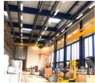
Gestion de la corrosion et protection incendie de l'acier structural avec SikaCor® et Sikacrete® 213F.