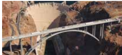
Colorado River Bridge, Hoover Dam Bypass (USA) : Adjuvants pour la production de béton à haute résistance initiale.