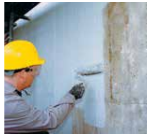
Sikagard® et Sika® FerroGard® : Enduits de protection pour béton et systèmes de contrôle de la corrosion.