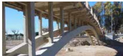
Pont de Lorca (Espagne) : Réhabilitation complète du second plus vieux pont en béton armé d'Espagne. Construit en 1910, le pont a été sévèrement endommagé suite au tremblement de terre de 2011.