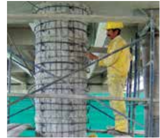
Sika® MonoTop®, Sika® Top® et SikaRepair® : Mortiers cimentaires pour les réparations sur béton.