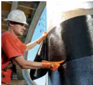
Sika® Carbodur®, SikaWrap®, Sika® CarboStress® et Sika® CarboShear : Systèmes de renforcement structural.