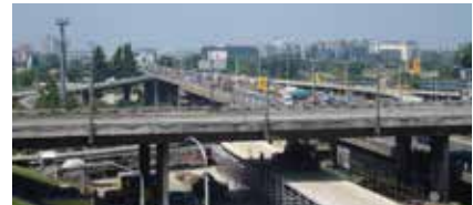
Pont 'Gazela', Belgrade (Serbie) : Liaisonnement structural et réalisation de l'étanchéité des joints.