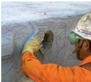
Sikadur® et Sika AnchorFix® : Liaisonnement du béton et ancrage structuraux