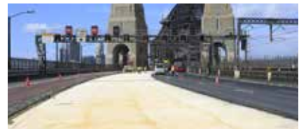
Sydney Harbour Bridge (Australie) : Système d'étanchéité et anti-corrosion à mûrissement rapide appliqué sur le tablier du pont (travaux réalisés avec un minimum d'interruption de la circulation).