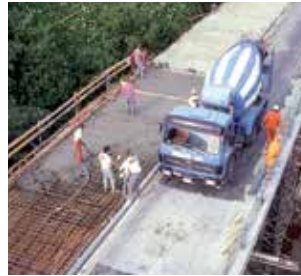
Sika® ViscoCrete®, SikaRapid® et Sika® Control : Adjuvants haute performance pour béton prêt à l'emploi.