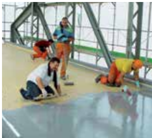
Sikagard® Cor-Pro : Préparation et protection des surfaces en acier.