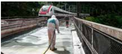
Pont ferroviaire Chärstelenbach, Amsteg (Suisse) : Application d'une membrane d'étanchéité sous forme liquide par pulvérisation sur le tablier du pont.