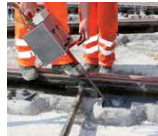
SikaGrout® et Sikadur®: Exécution de scellements et d'ancrages structuraux.