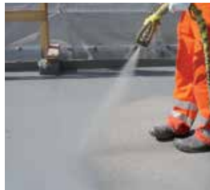
Sikalastic® et Sika® Injection : Membranes d'étanchéité et systèmes d'injection.