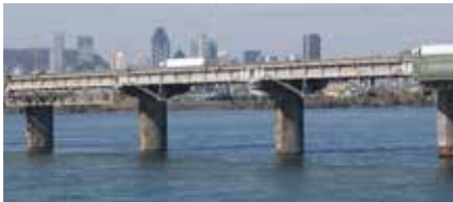
Pont Champlain, Montréal (Canada) : Systèmes de renforcement structural et de réparation du béton.