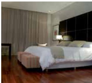
SikaBond® : Adhésifs pour les revêtements de sols en bois (chambres, salons, salles privées, etc.)