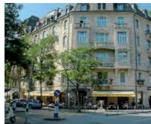
Hôtel Ambassador, Zürich (Suisse) : Systèmes d'étanchéité, solutions de réfection et de protection du béton Sika®.