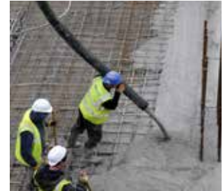
Sika® ViscoCrete® : Adjuvants pour béton prêt à l'emploi - Béton coulé au chantier, préfabriqué et projeté.