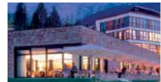
Complexe hôtelier Intercontinental, Berchtesgaden (Allemagne) : Solutions d'étanchéité et systèmes de revêtements de sol pour les cuisines.