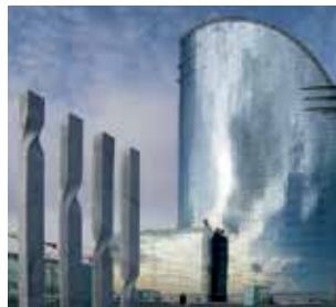
Sikasil® : Solutions pour la fabrication et l'installation de vitrage structural et de murs rideaux.