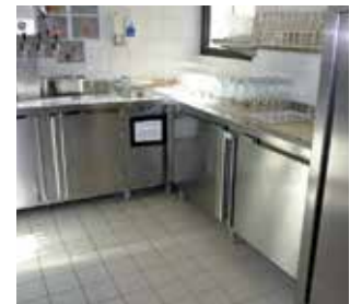
Sikafloor® : Revêtements de sols et systèmes étanches pour zones humides.