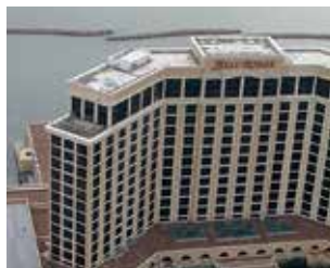
Hôtel MGM Beau Rivage, Biloxi (USA) : Système de toiture Sika® Sarnafil® installé au sommet de ce complexe hôtelier de 29 étages.