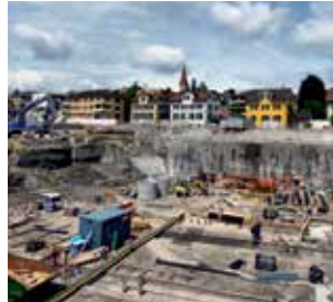
Solutions d'étanchéité pour fondations et éléments de construction sous le niveau du sol.