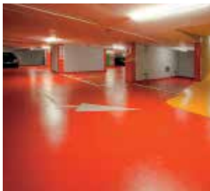
Sikalastic® : Membranes de stationnement durables et résistantes.