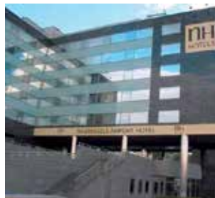
Sikaflex® : Scellement et étanchéité des joints de façade.