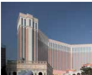
Hotel The Venetian, Macau (Chine) : Utilisation extensive des adjuvants à béton Sika® ViscoCrete® pour 350 000 m 3 de béton coulés au chantier, des fondations jusqu'au toit.

SIKA : DES SOLUTIONS À L'ÉCHELLE GLOBALE POUR LA CONCEPTION ET LA CONSTRUCTION D'HÔTELS.