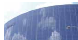
Hôtel Hyatt, Russie : Travaux de réfection de béton avec différents types de mortiers Sika®.