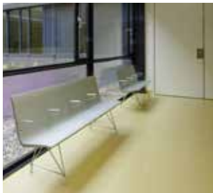
Revêtements de sols décoratifs Sikafloor® pour applications intérieures spécifiques.