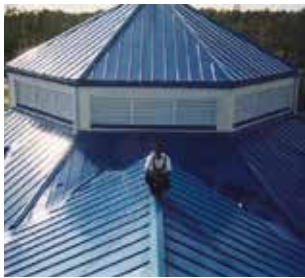
Nouvelles toitures et réfection avec les membranes Sika® Sarnafil® et Sikalastic® RoofPro.