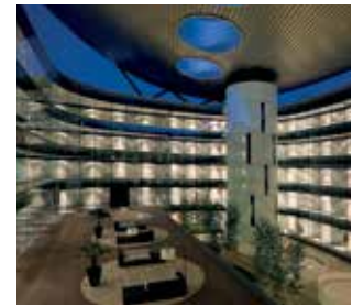
Sikaflex® & Sikasil® : Des gammes complètes pour le scellement et l'étanchéité des joints de façade.