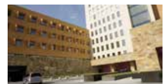
Centro Médico Zambrano Helion, Monterrey (Mexique) : Enduits muraux protecteurs/antimicrobiens Sikagard®.