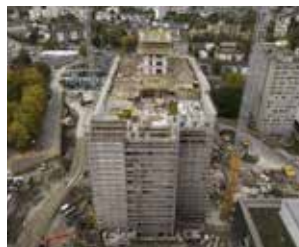
Hôpital Triemli, Zurich (Suisse) : Étanchéité des fondations et des zones en sous-sol (béton recyclé étanche avec adjuvants Sika® ViscoCrete® et autres systèmes d'étanchéité Sika®).