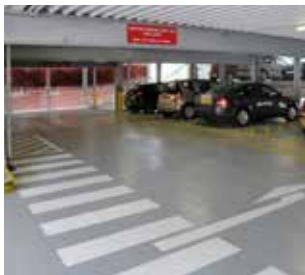
Membranes de stationnement Sikalastic® et systèmes de revêtement de sols Sikafloor® pour zones à fort trafic piéton.