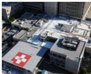
Hoag Memorial Hospital, Newport Beach (USA) : Réfection de toiture avec membrane en pleine adhérence Sika® Sarnafil® G410 (80 mils) EnergySmart.