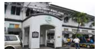
Locsin Montelibano Memorial Hospital (Philippines) : Réhabilitation d'un monument historique à l'aide du système Sika® Carbodur®.