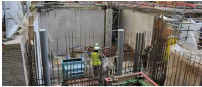
Solutions d'étanchéité Sika® pour les fondations et autres éléments de structure sous le niveau du sol.