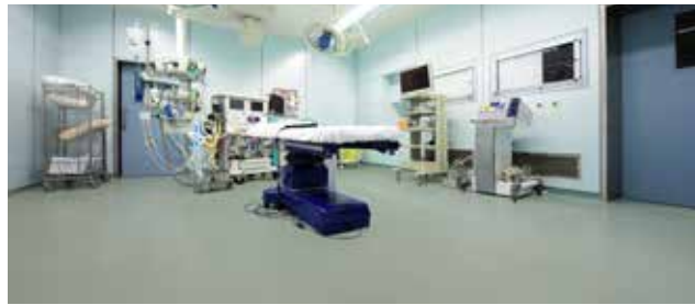
Sikafloor® & Sikagard® : Revêtements de sols et enduits muraux protecteurs et décoratifs haute performance pour environnements hospitaliers.